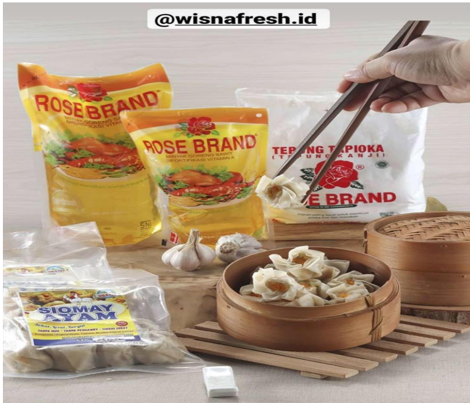
Ket : Foto produk siomay ayam