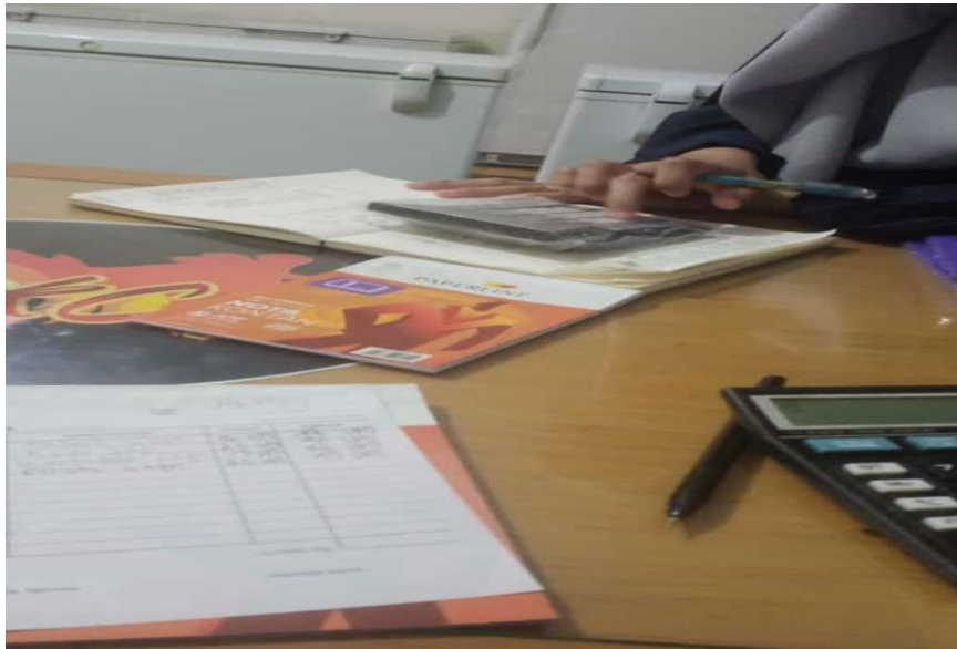
Ket : Foto saat wawancara