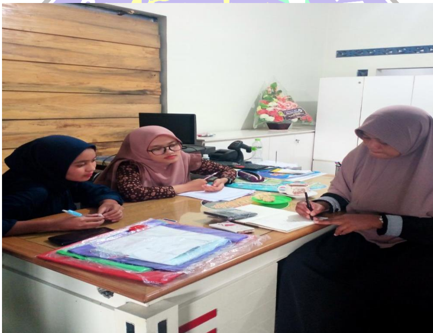
Ket : Foto saat wawancara