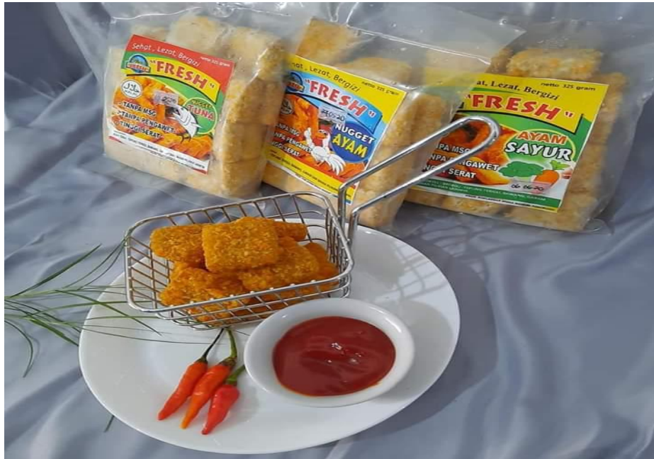
Ket : Foto produk nugget ayam