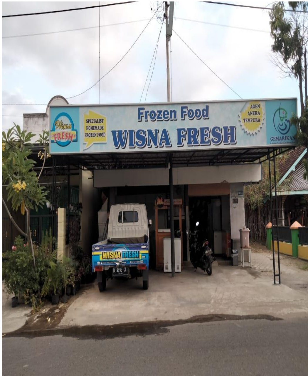
Ket : Foto Wisna Fresh nampak depan