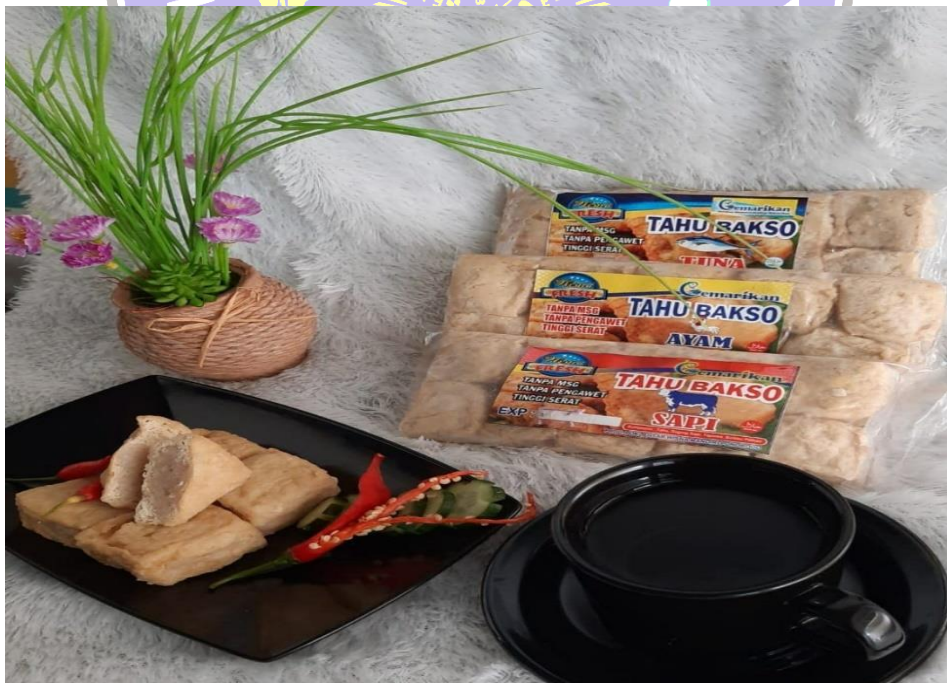
Ket : Foto produk tahu tuna