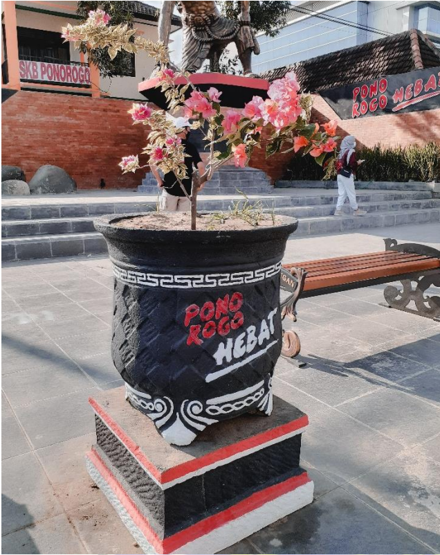
Slogan Ponorogo Hebat yang ditempatkan di Pot Tanaman