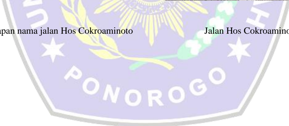
Jalan Hos Cokroaminoto