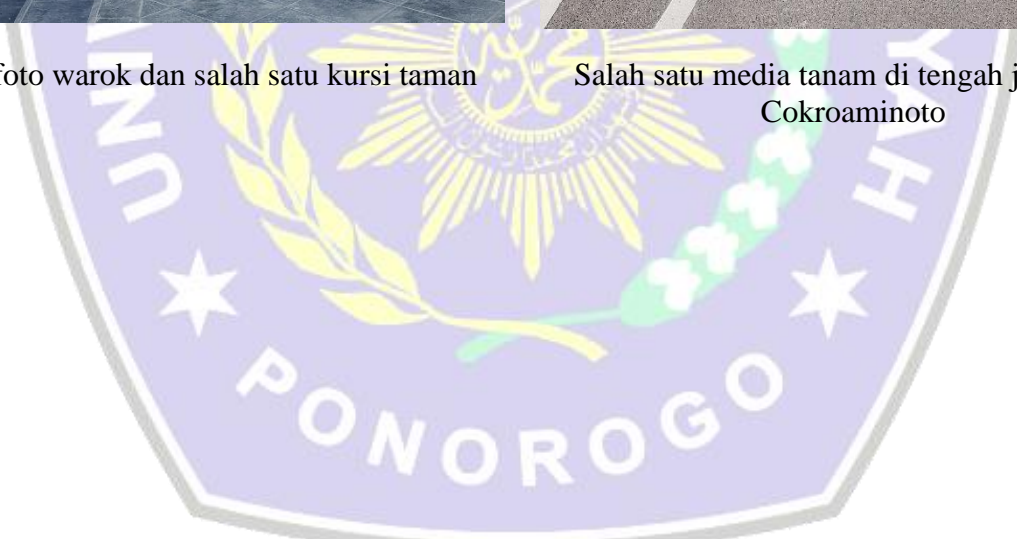
Salah satu media tanam di tengah jalan Hos Cokroaminoto