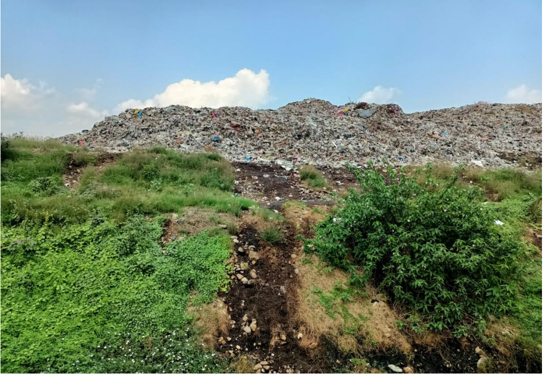
Kondisi Tumpukan sampah Dari Sisi Sebaliknya