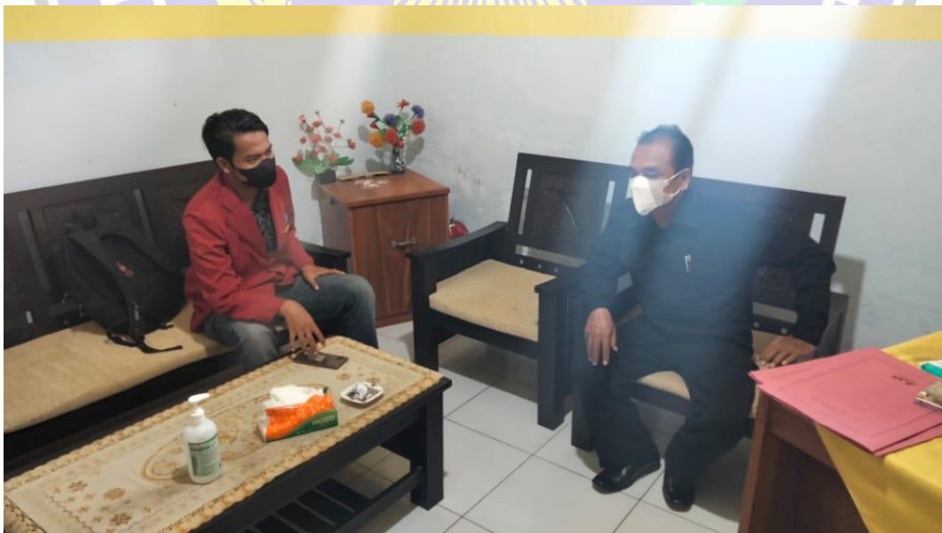
Wawancara Dengan Kepala Desa Mrican