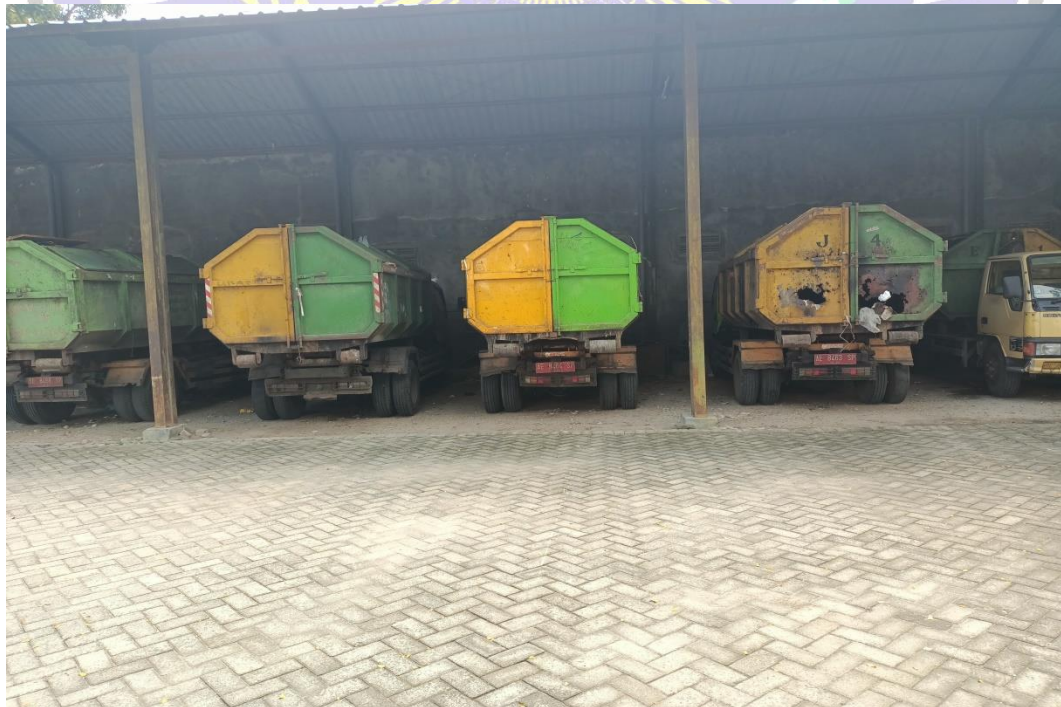
Kendaraan Pengangkut yang dimiliki DLH Ponorogo