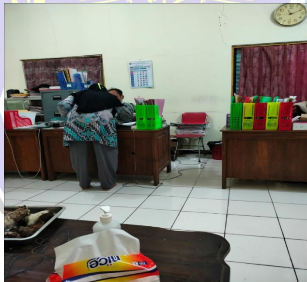
PELAYANAN ADMINISTRASI TERHADAP MASYARAKAT