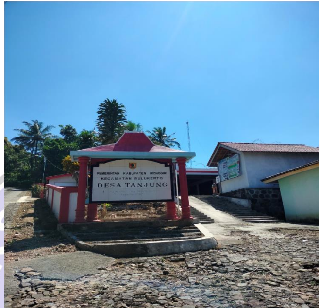
KANTOR KEPALA DESA