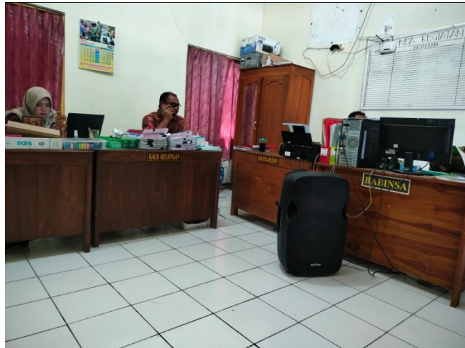
RUANG KANTOR PELAYANAN ADMINISTRASI DESA