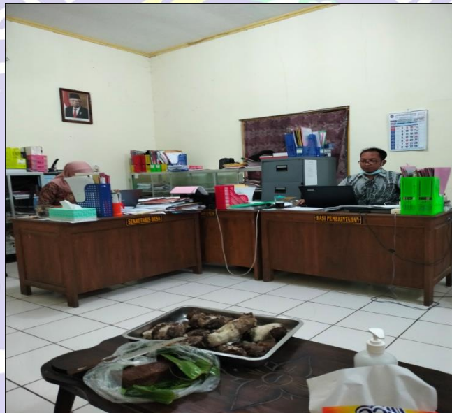
RUANG KANTOR STAFF DESA