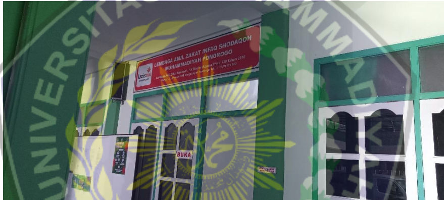
Kantor LAZISMU Ponorogo