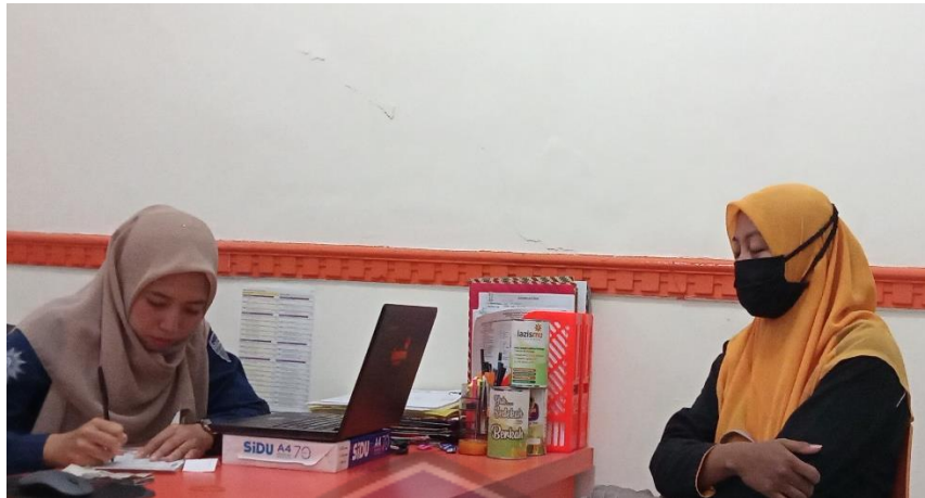
Pelayanan pembayaran ZIS di LAZISMU Ponorogo