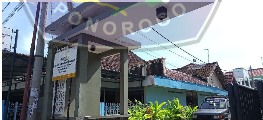
Kantor LAZISMU Ponorogo yang bertempat di PDM Ponorogo Jl. Jawa No. 38, Mangkujayan Ponorogo