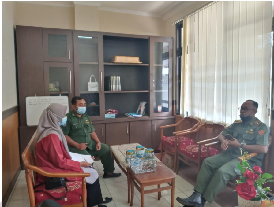
Wawancara dengan Kepala Bidang Pengendalian Pendapatan Daerah BPPKAD Kabupaten Ponorogo