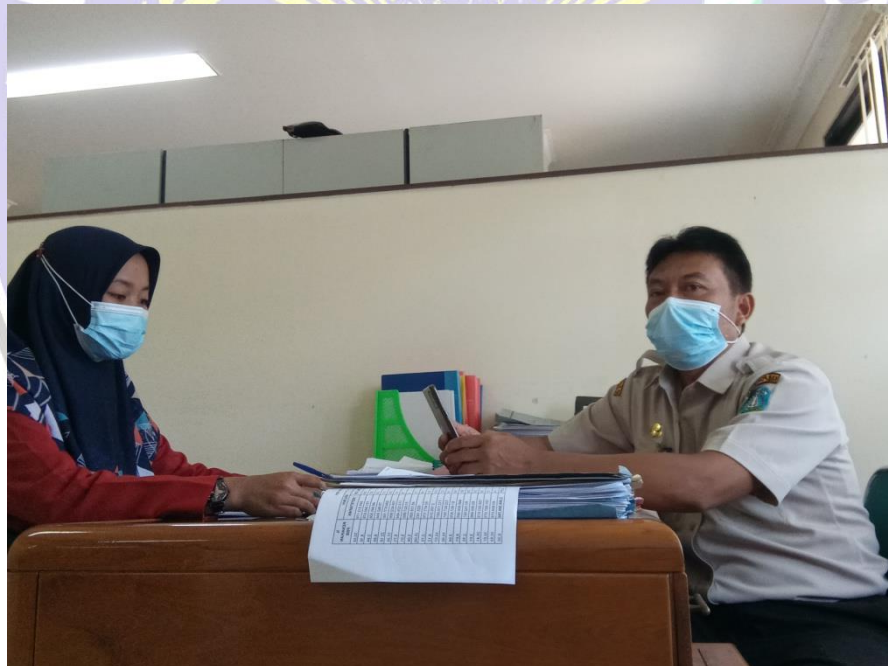
Wawancara dengan Kepala Sub Bidang Pendataan dan Penetapan Bidang Pajak Daerah BPPKAD Kabupaten Ponorogo