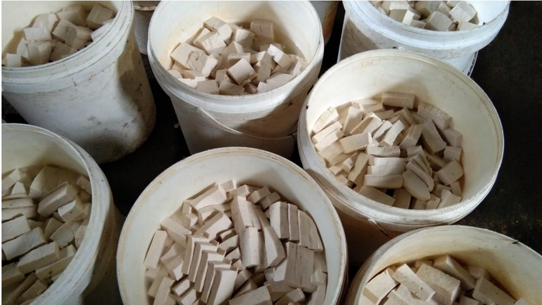
Gambar 3.2 Hasil