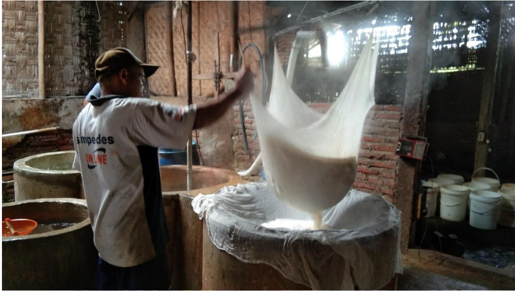
Gambar 3.0 Penyaringan sari Tahu