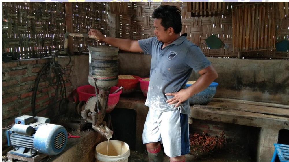
Gambar 2.9 Penggilingan biji kedelai