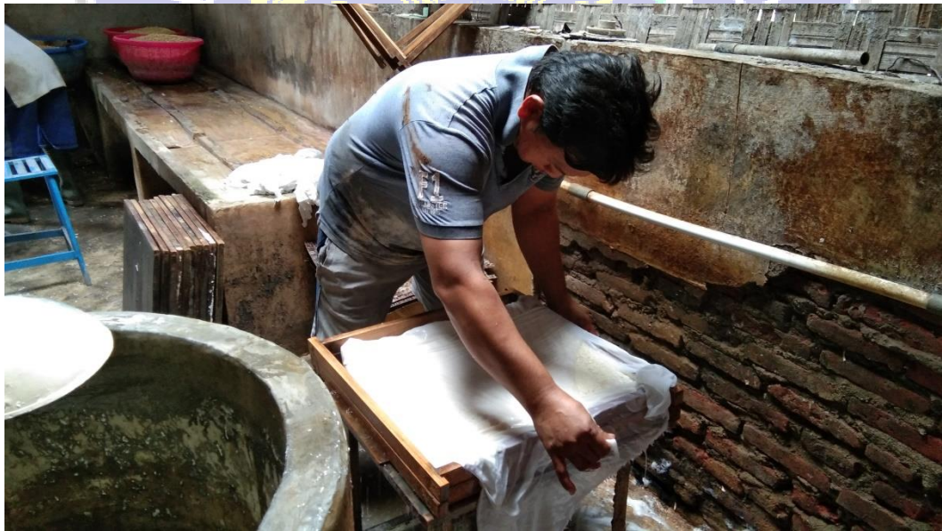
Gambar 3.1 Proses pencetakan Tahu