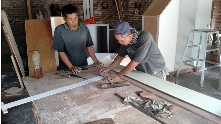
2. Foto produk setengah jadi