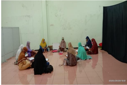
Kegiatan pembelajaran dikelas