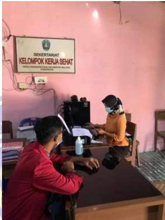
Gambar 3.1(Dokumentasi Wawancara Dengan Kaur Pemerintahan)