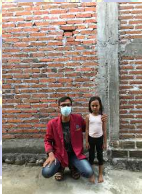
Gambar 3.5 (Dokumentasi Dengan Penerima Beasiswa)