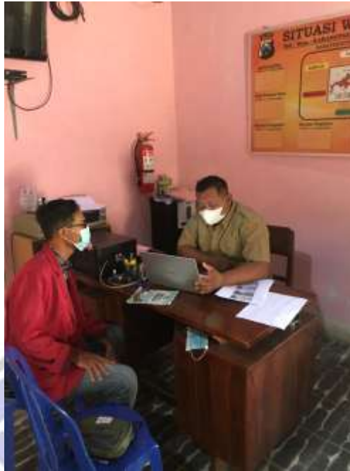
Gambar 3.2(Wawancara Dengan Sekretaris Desa)