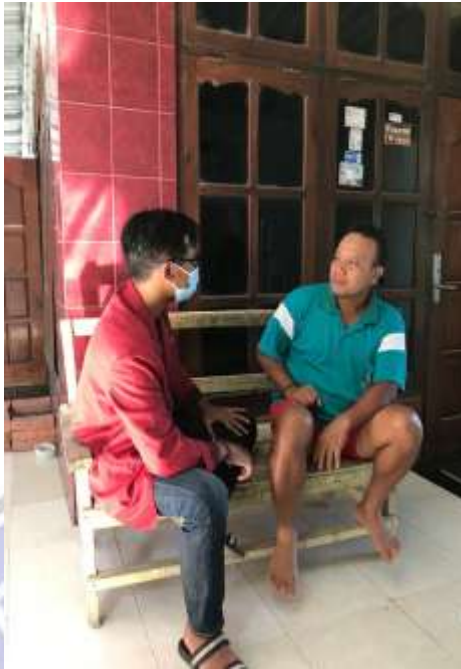
Gambar 3.4 (Wawancara Dengan Masyarakat Selaku RT)