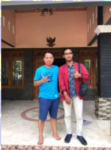
Gambar 3.3(Wawancara Dokumentasi Dengan Kepala Desa)