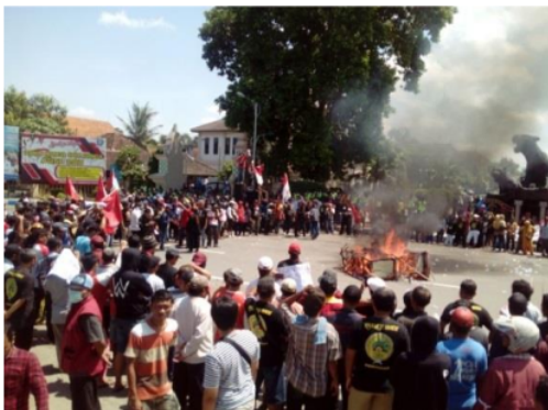
Gambar 4. Dokumentasi Unjuk Rasa

Ribuan massa yang mengatasnamakan Aliansi Masyarakat Ponorogo Tertindas menggelar aksi unjuk rasa di depan Gedung DPRD dan Kantor Pemkab Ponorogo pada Rabu (11-04-2018). Berbagai elemen yang melebur menjadi satu diantaranya adalah: kelompok Bentor, pekerja tambang Sampung, warga terdampak pembangunan waduk Bendo, kelompok pedang kaki lima, serta pedagang pasar Songgolangit Ponorogo. Massa melampiaskan kekecewaannya dengan cara melakukan orasi secara bergilir, kemudian membuat sebuah aksi teaterikal yakni membakar patung replika Bupati serta gerobak sebagai wujud kekecewaan. (Arso, 2018).