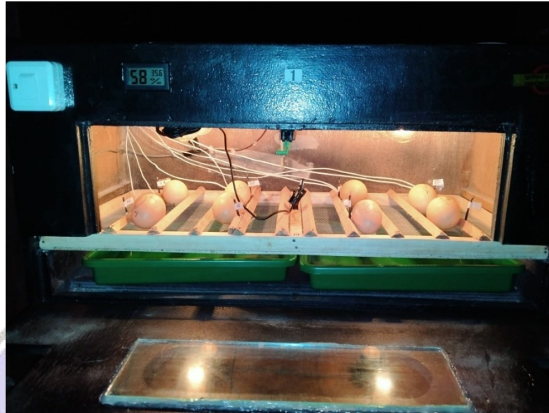
Lampiran 1. Dokumentasi telur sebelum dilakukan pengambilan data