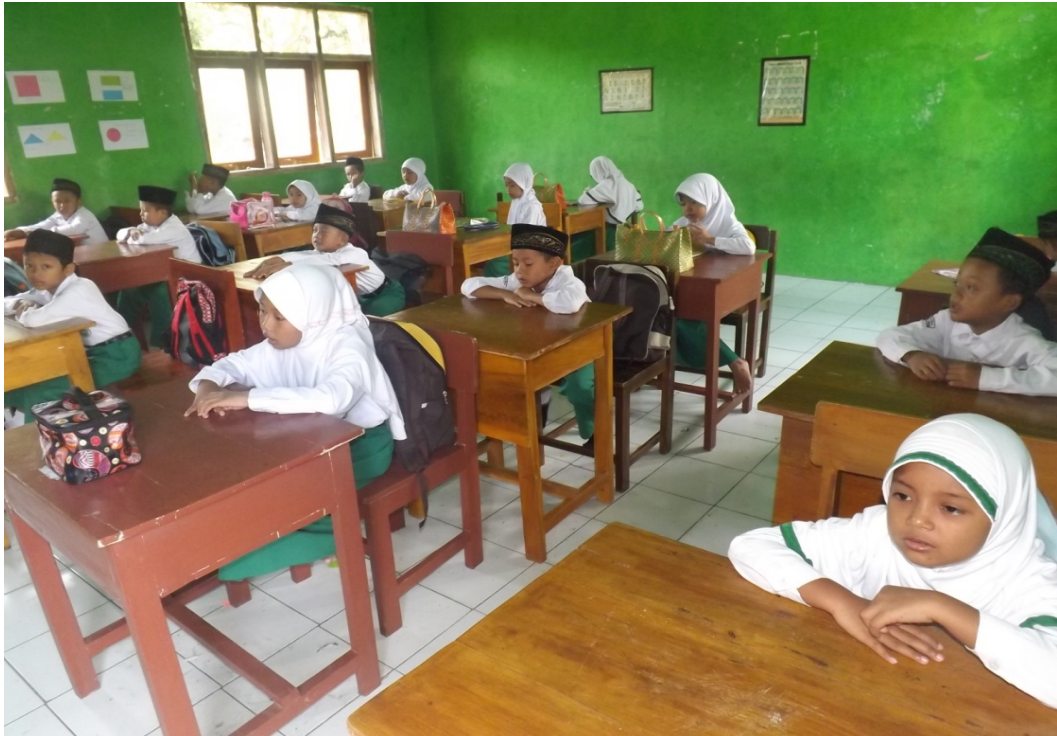
FOTO SIWA-SISWI MI MA'ARIF AL-ISHLAH