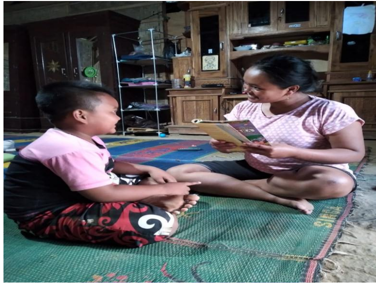
Gambar 3. Kegiatan Belajar HNDA Di Rumah Dengan Ibu RW