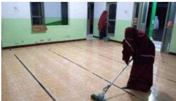
Foto kegiatan santri di Pondok Pesantren 'Ainul Mardhiyyah Jetis-Ponorogo