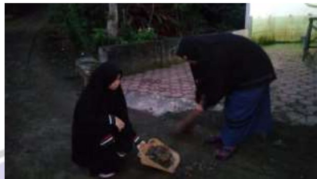
Kegiatan bersih-bersih di asrama