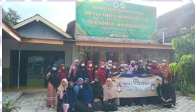
Foto setelah kegiatan pengabdian masyarakat