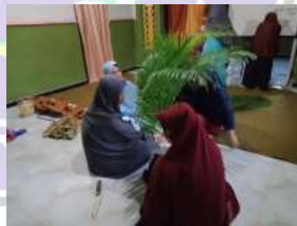
Foto persiapan dan kegiatan muhadhoroh