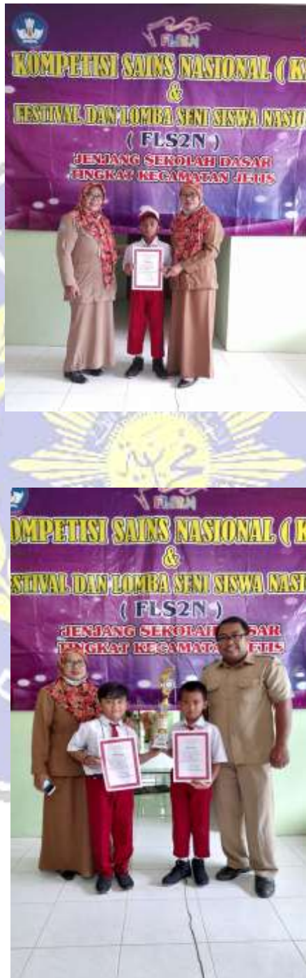
FOTO SALAH SATU KEUNGGULAN SDN 01 JOSARI DALAM MENJUARI NON AKADEMIK DAN AKADEMIK DI TINGKAT KECAMATAN