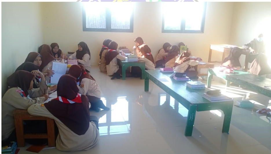
2. Kegiatan Diskusi Kelompok Sebelum Sorogan Per-kelompok