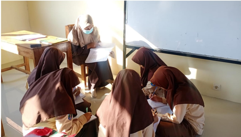
3. Kegiatan Sorogan Materi Per-kelompok