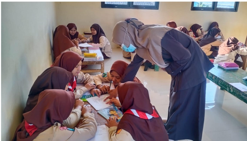
4. Kegiatan Diskusi Kelompok