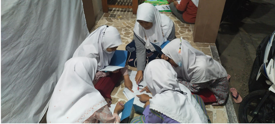
1. Kegiatan Diskusi Kelompok