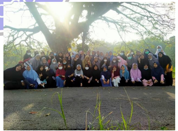
Peserta camp jalan-jalan pagi serta tadabbur alam