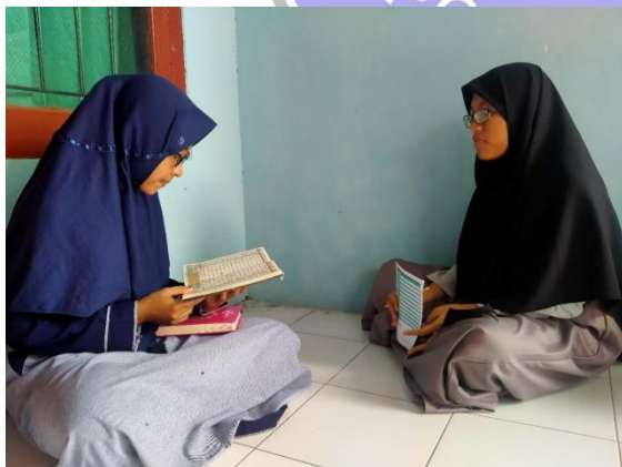
Musyrifah tahfidz menyimak hafalan peserta camp