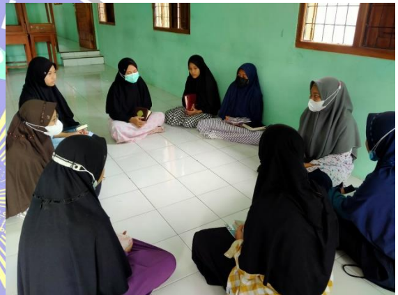
Berkumpul untuk berdo'a sebelum memulai tahfidz