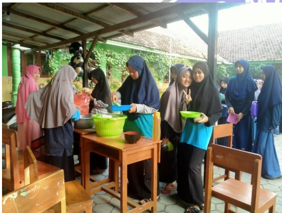
Peserta Camp Qur'an mengantre untuk sarapan

Kode : 03/D/VII/2021 Tanggal Pengamatan : Gambar atau foto Isi Dokumen : Kegiatan Camp Qur'an Pondok Pesantren Darut Taqwa Ponorogo Tanggal : 10 Juli 2021 Disusun Jam : 20.15 WIB