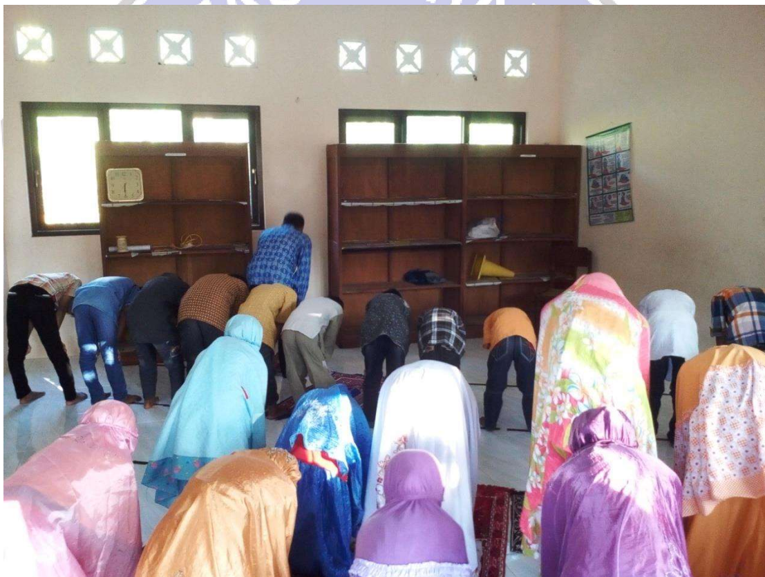
Gambar : Kegiatan shalat dhuha berjama'ah sebelum pembelajaran dimulai

Kode : 03/D/12-07/2020 Bentuk : Foto Lokasi : SD Negeri 2 Plalangan Isi Dokumen : Kegiatan shalat dhuha berjama'ah Tanggal Pencatatan : 12 Juli 2020 Jam Pencatatan : 08.00 WIB