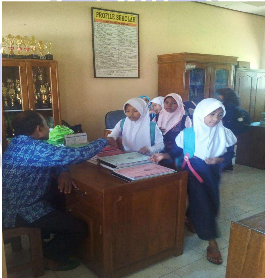
Gambar: Anak-anak bersalaman dengan guru ketika akan pulang sekolah

Kode : 01/D/12-07/2020 Bentuk : Foto Lokasi : SD Negeri 2 Plalangan Isi Dokumen : Perilaku yang memperlihatkan kepribadian siswa Tanggal Pencatatan : 12 Juli 2020 Jam Pencatatan : 08.00 WIB