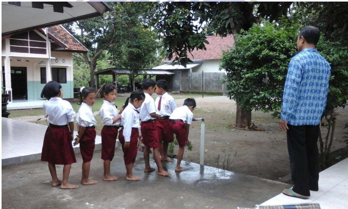
Gambar: Kegiatan wudku siswa yang dibimbing oleh guru

Kode : 02/D/12-07/2020 Bentuk : Foto Lokasi : SD Negeri 2 Plalangan Isi Dokumen : Kegiatan wudhu sebelum melaksanakan shalat dhuha Tanggal Pencatatan : 12 Juli 2020 Jam Pencatatan : 08.00 WIB