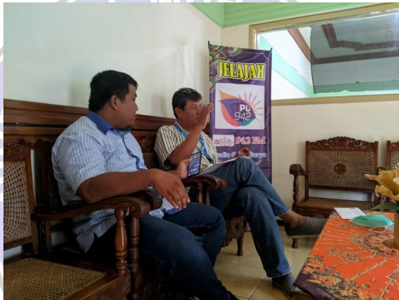
Foto wawancara ke 1 secara langsung penulis bersama Kordinator admin PO942 di kantor Radio Gema Surya FM, pada tanggal 4 Desember 2020.