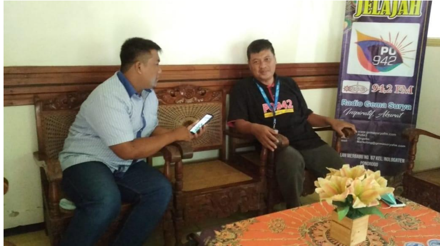
Foto wawancara ke 2 secara langsung penulis bersama Koordinator admin PO942 di kantor Radio Gema Surya FM, pada tanggal 12 Desember 2020.