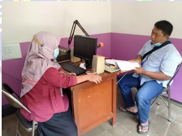
Foto wawancara ke 3 secara langsung penulis bersama gatekeeper di kantor Radio Gema Surya FM, pada tanggal 12 Desember 2020.