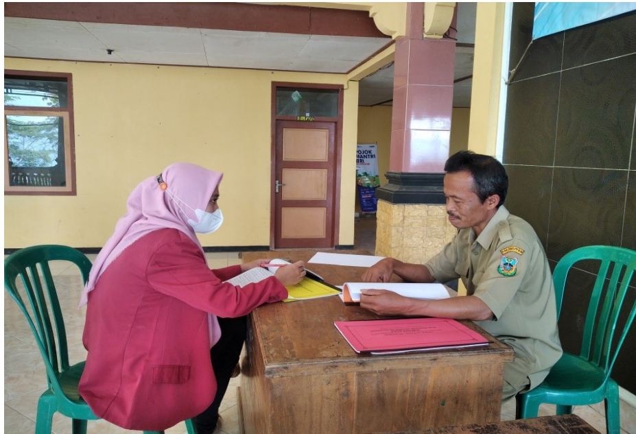
Gambar 4.22 wawancara dengan bendahara Desa Wonoasri