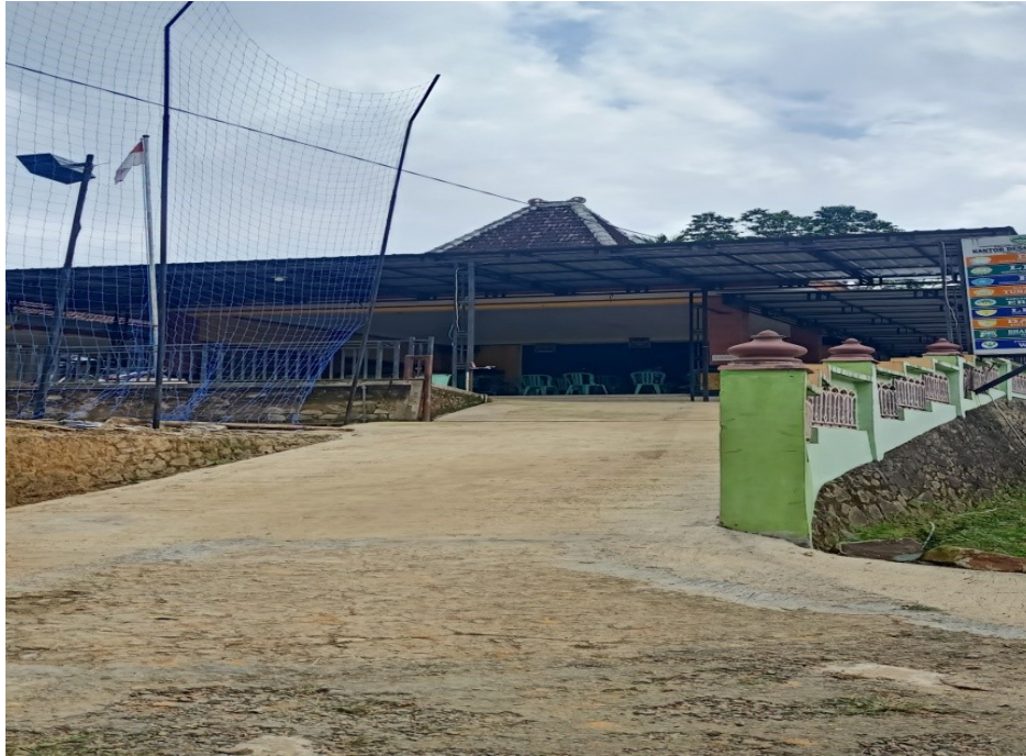
Gambar 4.3 Kantor Desa Wonoasri