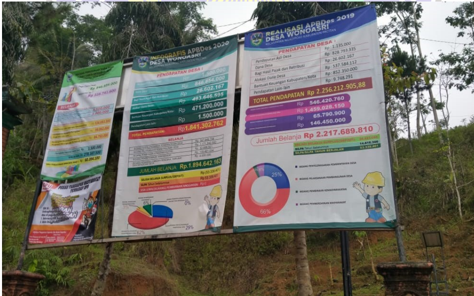
Gambar infografis APBDes Desa Wonoasri