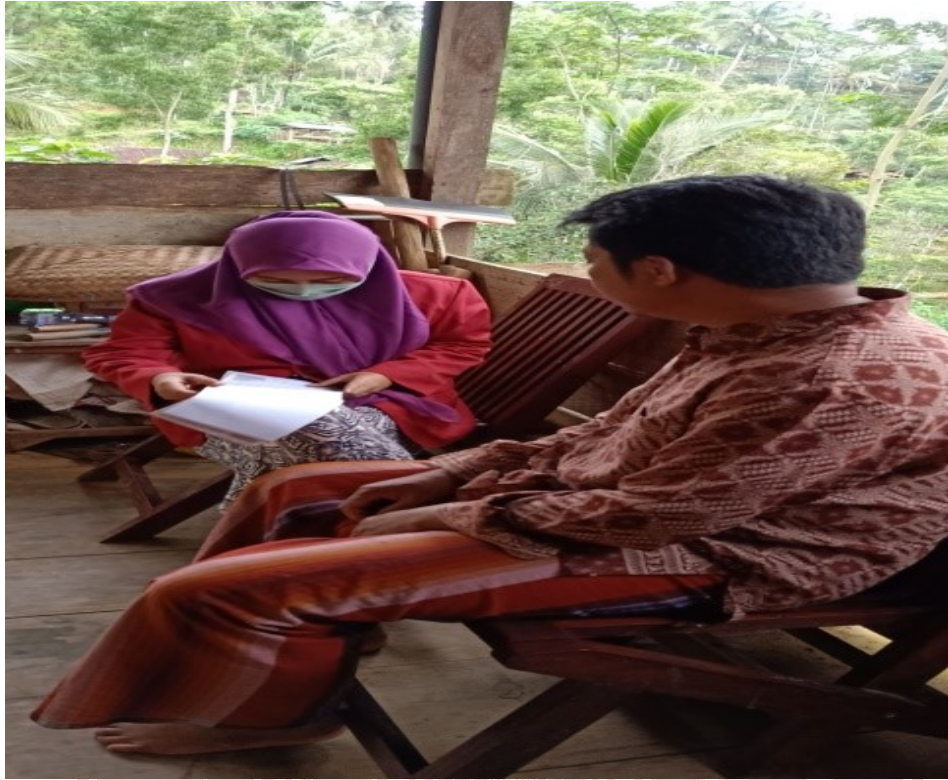
Gambar 4.20 wawancara dengan perwakilan masyarakat desa