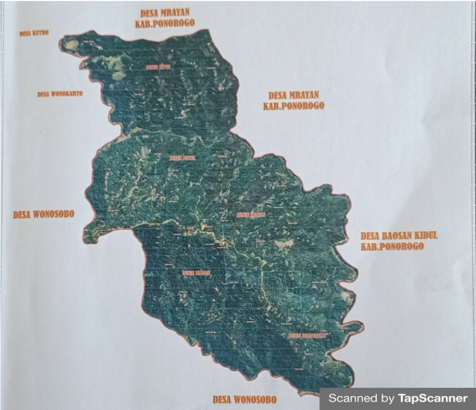
Gambar Peta Desa Wonoasri