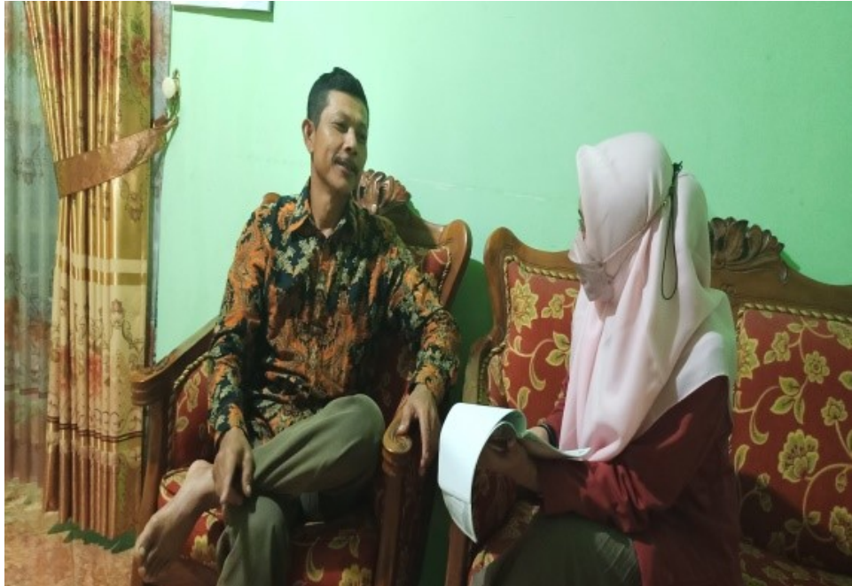
Gambar 4.19 wawancara dengan sekretaris desa wonoasri