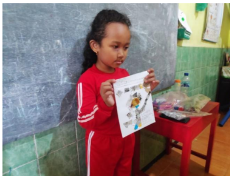
Gambar 2. Kegiatan berkreasi dengan tutup botol bekas dan kertas bekas

Penerapan metode 3R dengan kreasi bahan bekas dari tutup botol dan kertas bekas. Hasil dari kegiatan 3R dengan kreasi bahan bekas dari kertas bekas dan tutup botol bekas anak dapat berkreasi sesuai dengan imajinasinya. Hal tersebut ditunjukkan dengan hasil karya anak. Kreasi antar anak pastinya berbeda, ada yang membuat bentuk bunga dan ada juga yang membuat bentuk matahari.