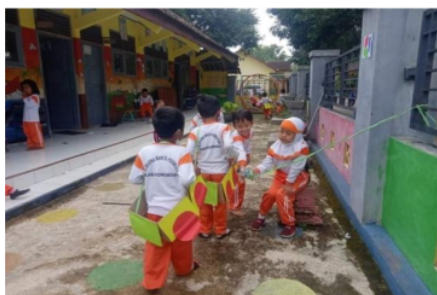
Gambar 4. Kegiatan berkreasi dengan kardus bekas

dengan arahan; anak mampu memadu padankan warna, menyesuaikan bentuk rumah dan mobil, dan anak dapat menggambar pola tertentu untuk menambah nilai keindahan pada rumah-rumahan dan mobil-mobilan tersebut. Selain itu kreativitas anak terasah dan dapat dilihat dari bagaimana cara anak menyusun kardus sehingga membentuk bentuk rumah dan mobil, memilih warna untuk cat rumah dan mobil, dan menghias rumah.