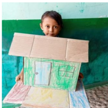
Gambar 3. Kegiatan berkreasi dengan kardus bekas

dengan media kertas bekas dan tutup botol bekas kreativitas dan rasa ingin tahu anak meningkat, hal itu dapat dilihat ketika anak memilih jenis kertas, warna tutup, serta memilih media tambahan untuk mempercantik karya yang mereka buat.