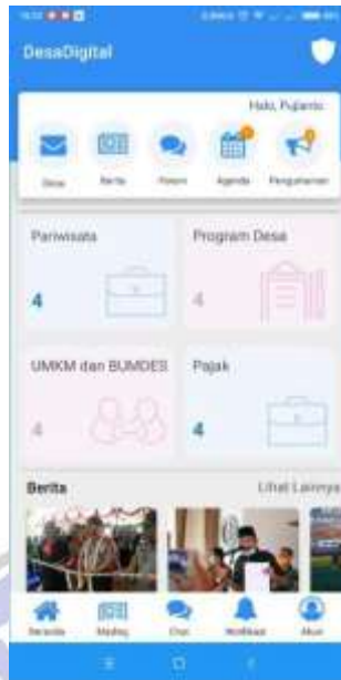
Gambar 1. Halaman Utama Aplikasi “DesaDigital”

Dalam pelatihan dan pengadaan aplikasi “Desa Digital” ini Pemerintah Desa Grogol bekerjasama dengan PT. Razen Teknologi Indonesia. Kerjasama ini dilakukan oleh Kecamatan Sawoo dengan memberikan pelatihan pengoperasian sistem dari aplikasi ini yang dilakukan kepada 13 desa yang ada di wilayah Kecamatan Sawoo. Pelatihan diberikan kepada satu perwakilan dari desa masing” yang nantinya akan dijakian sebagai operator pengelola aplikasi “DesaDigital”.