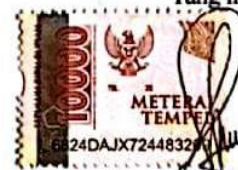
Wildan Sifai Prasetyo