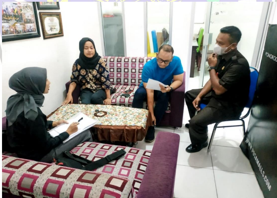
Wawancara Langsung Dengan General Manajer, Kepala PT CSI, Kepala Carefast Dan Kepala Center Park