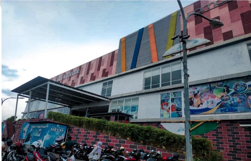
Lokasi Penelitian Mal Ponorogo City Center