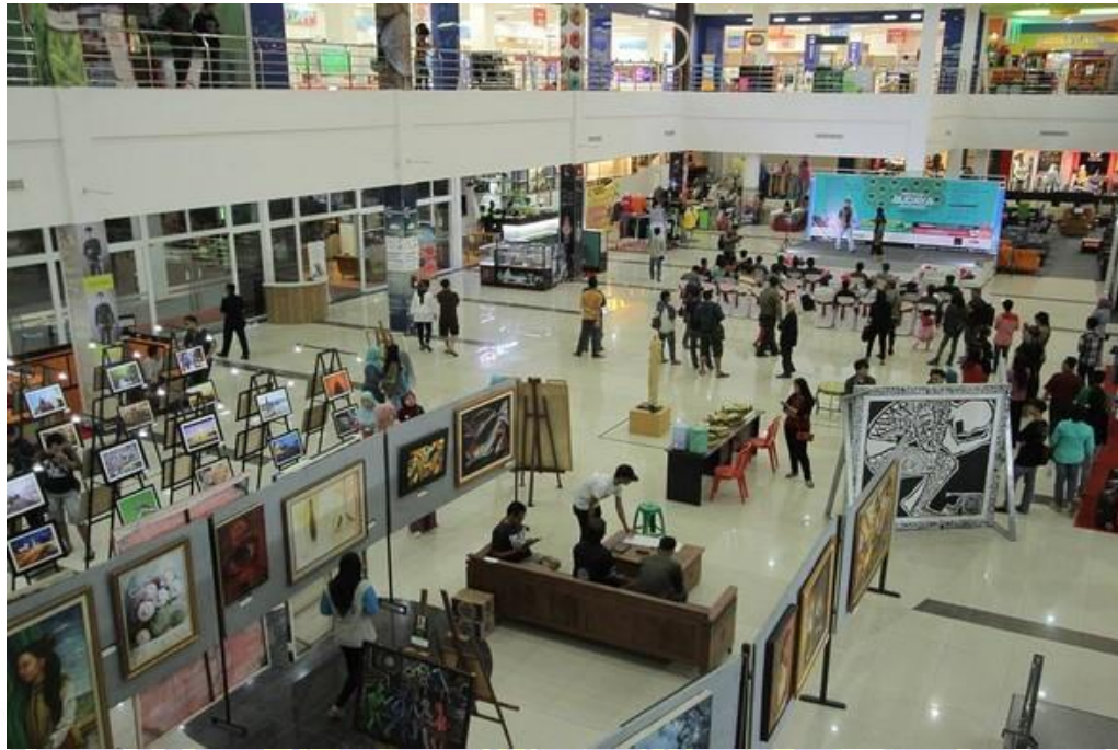
Kondisi Mal Sebelum Pandemi