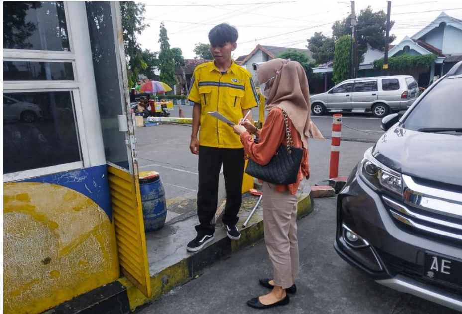
Wawancara Langsung Dengan Karyawan Penjaga Parkir