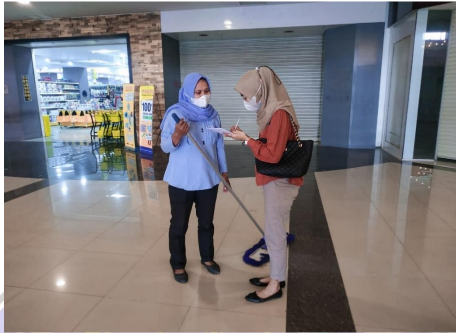
Wawancara Langsung Dengan Karyawan Cleaning Service