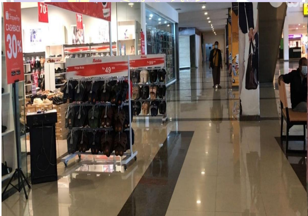
Kondisi Mal Masa Pandemi