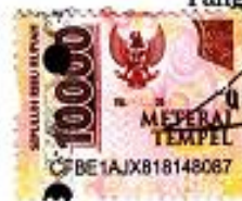
Aji Cahyo Wibowo