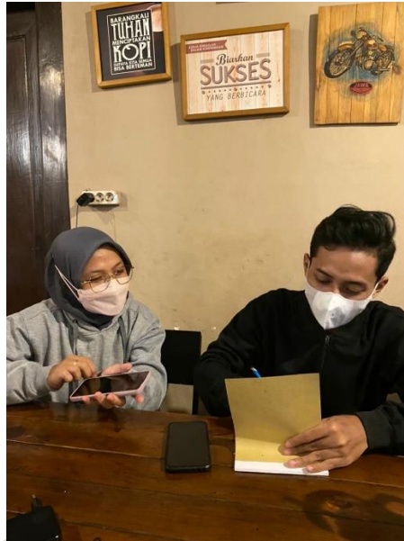
Wawancara dengan follower akun instagram @ponorogokab atas nama @laily_nurrohmah