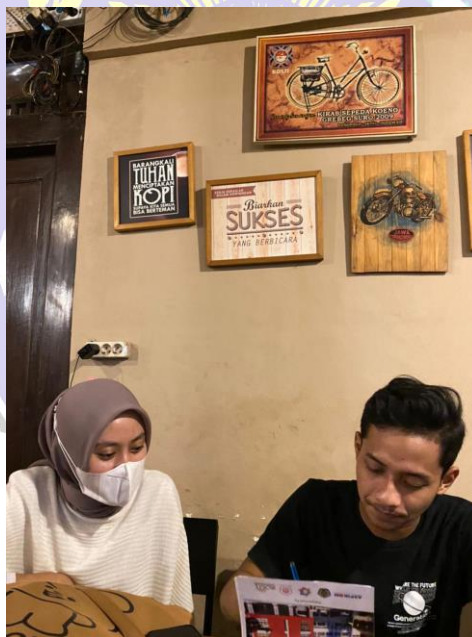
Wawancara dengan follower akun instagram @ponorogokab atas nama @teamaulida