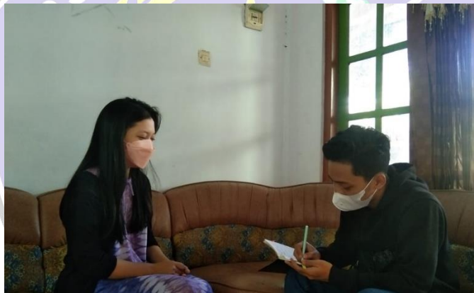
Wawancara dengan follower akun instagram @ponorogokab atas nama @youcee100