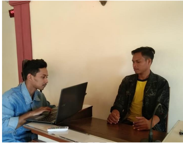
Wawancara dengan follower akun instagram @ponorogokab atas nama @mukhlisode