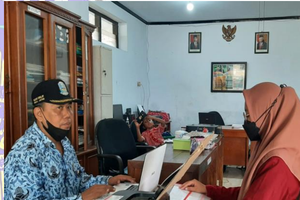
Gambar 4. Wawancara Sekdes Campursari