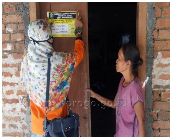
Gambar 9. Pemberian tanda stiker pada rumah penerima BLT DD