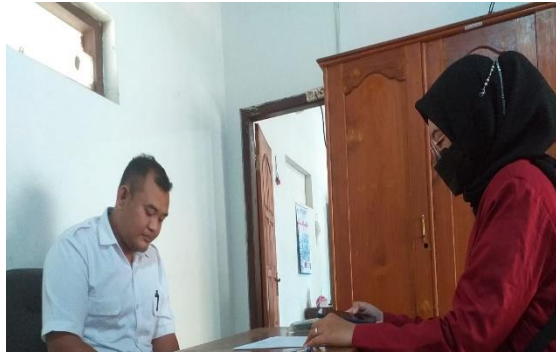
Gambar 7. Wawancara Sekdes Wilangan