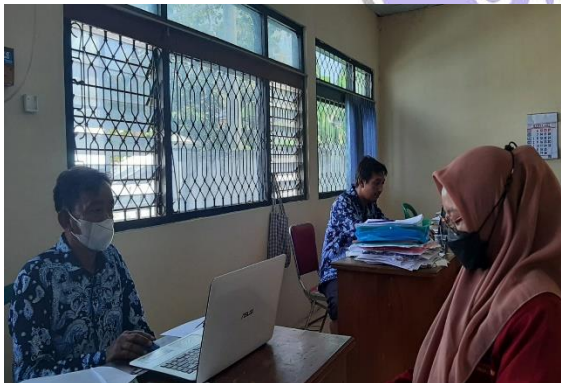
Gambar 5. Wawancara Kaur Bancangan