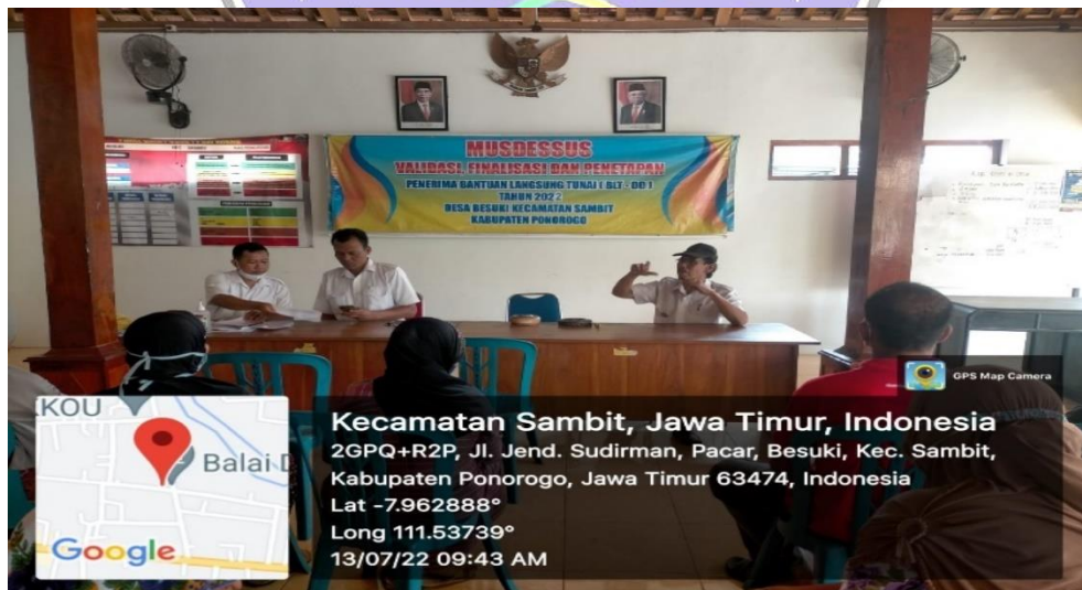
Gambar 11. Penyaluran BLT DD di Desa Besuki