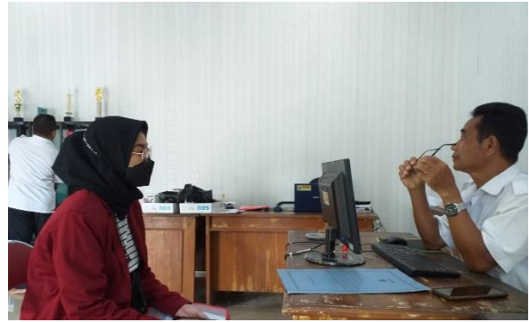
Gambar 8. Wawancara Sekdes Campurejo