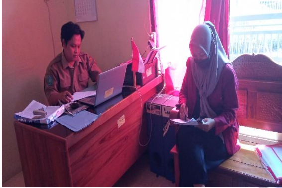
Gambar 1. Wawancara Sekdes Besuki