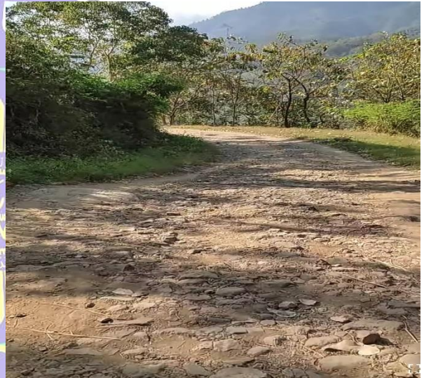
Gambar 12. Foto akses jalan rusak pada desa di Kecamatan Sambit