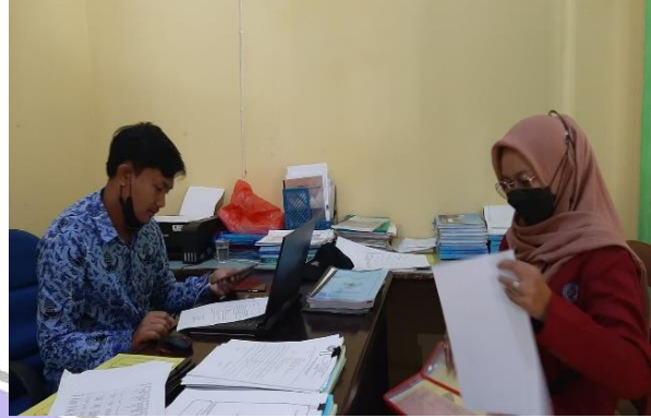
Gambar 2. Wawancara Sekdes Bedingin