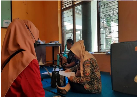
Gambar 3. Wawancara Kades Wringinanom