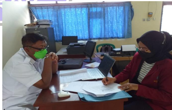
Gambar 6. Wawancara Sekdes Bancangan