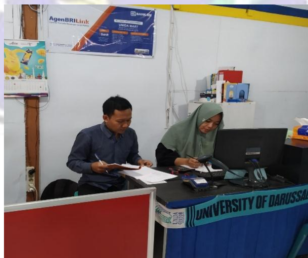
Foto Wawancara Kepada Staff Admin