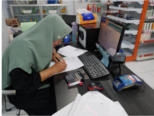
Foto Staff Admin Melakukan Proses Penginputan Data