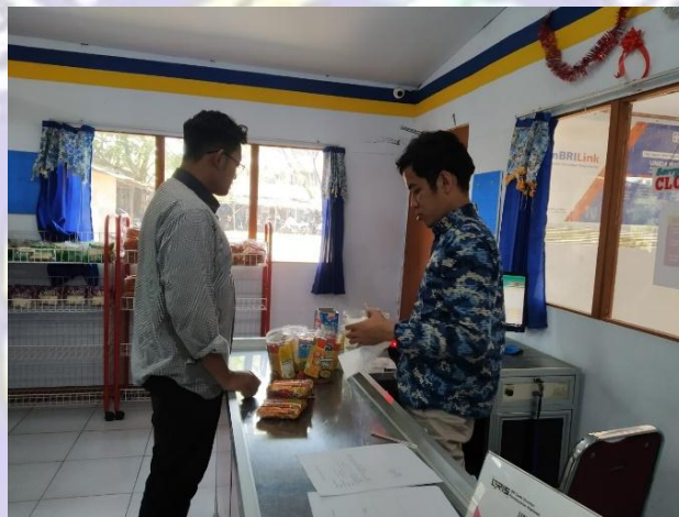
Foto Transaksi Di Kasir