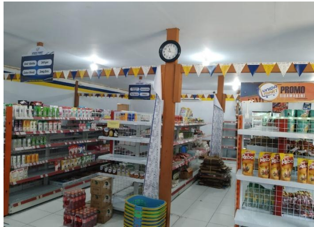
Tampilan Rak Display Unida Minimarket