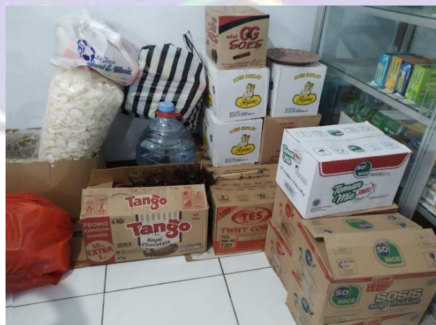
Foto Gudang Penyimpanan