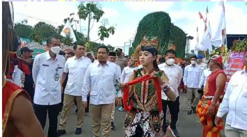
Gambar 11 Kegiatan Pelantikan Kader Gerindra oleh Bupati Magetan di Embung Pendem