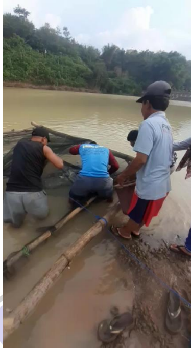
Gambar 10 Kegiatan Persiapan Untuk Lomba Memancing di Embung Pendem