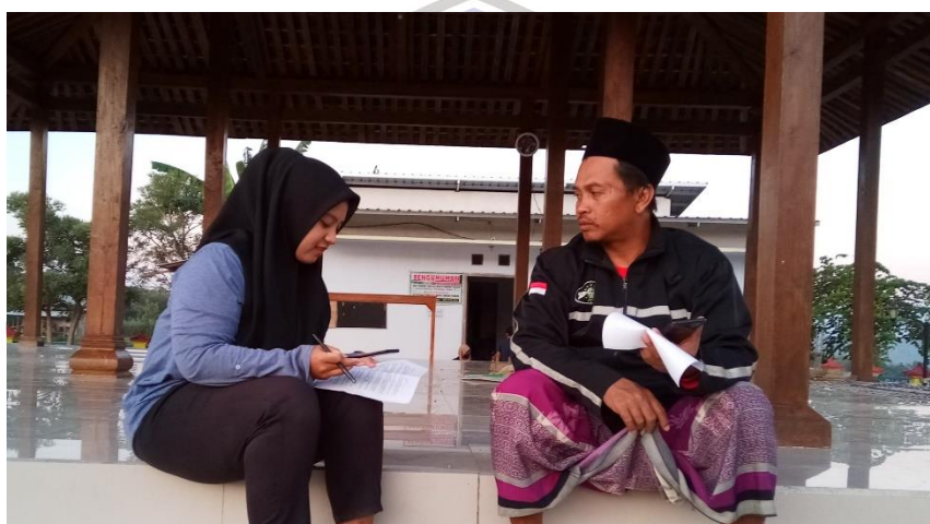
Gambar 8 Wawancara dengan Ketua BUMDes Tirta Mulya