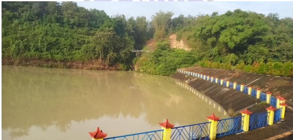
Gambar 5 Embung Pendem , diambil dari sebelah Timur