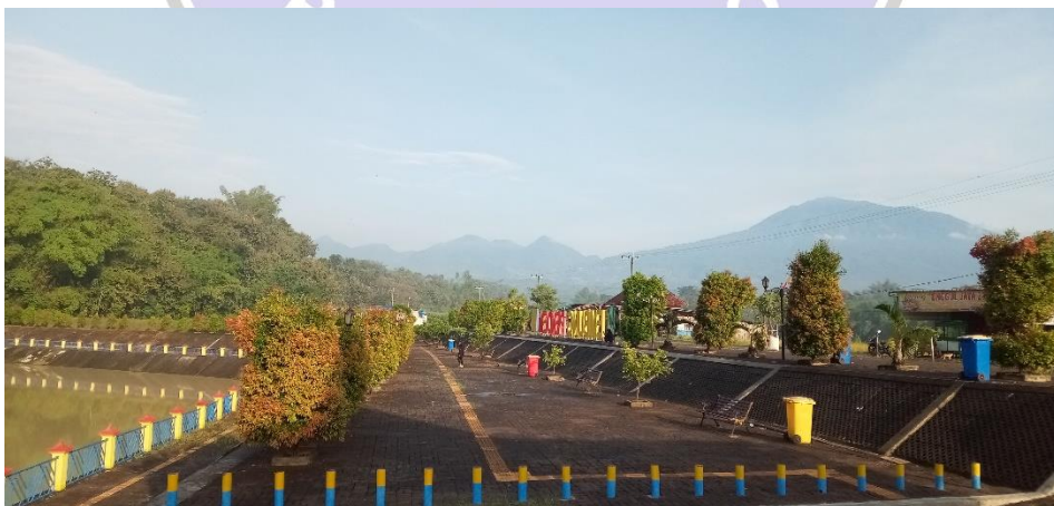
Gambar 6 Embung Pendem