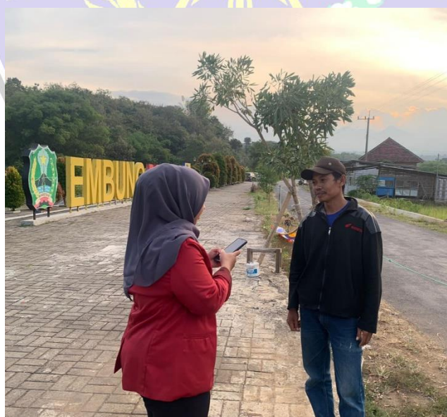
Gambar 9 Wawancara dengan Salah Satu Pengunjung Embung Pendem