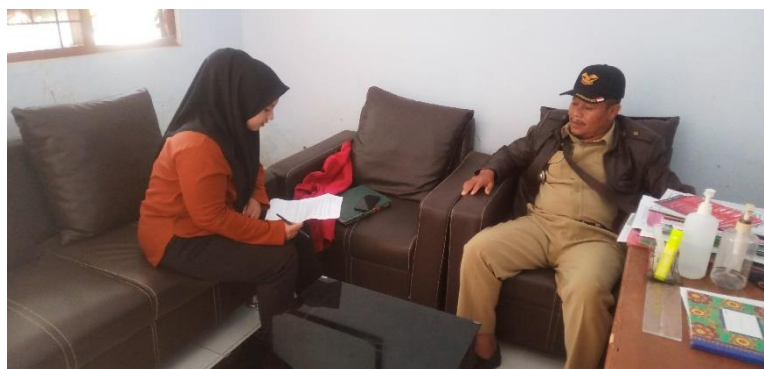
Gambar 7 Wawancara dengan Kepala Desa Pendem