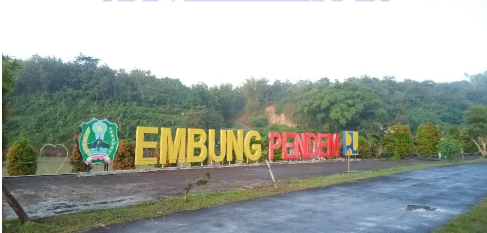
Gambar 2 Tampak Depan Embung Pendem