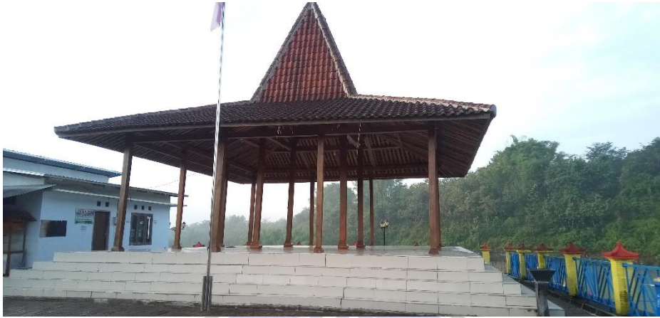
Gambar 1 Pendopo di Embung Pendem