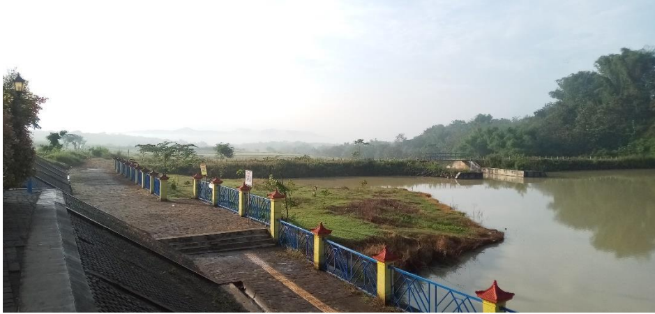
Gambar 4 Embung Pendem , diambil dari sebelah barat