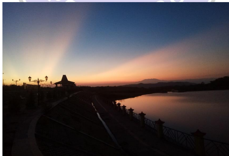
Gambar 3 Embung Pendem di Pagi Hari