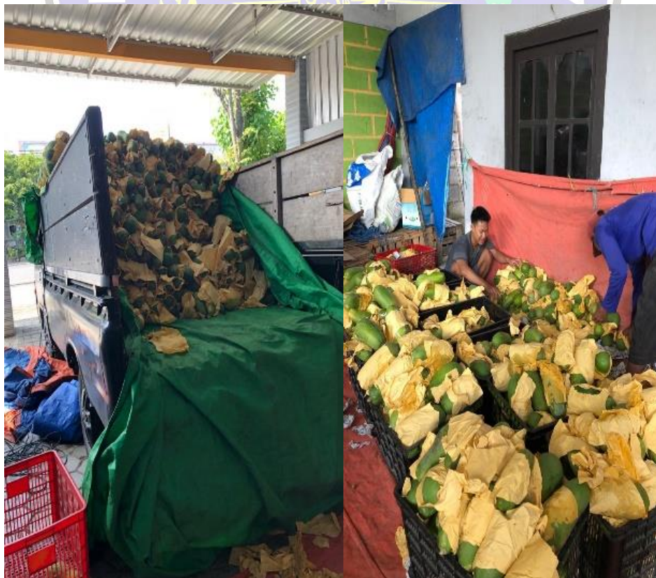
Proses Kedatangan Buah dan Penataan Buah