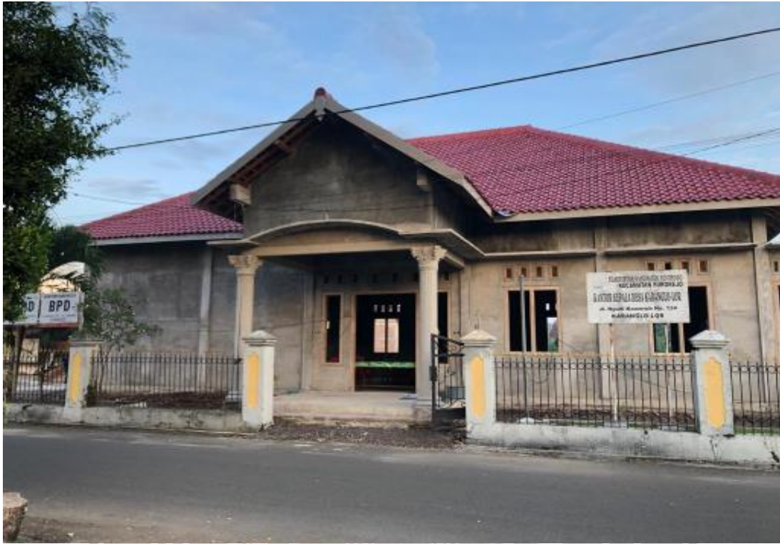
Kantor Balai Desa Karanglo-lor