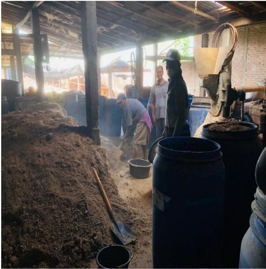
Proses Penggilingan dan Pencampuran Pa kan Sapi