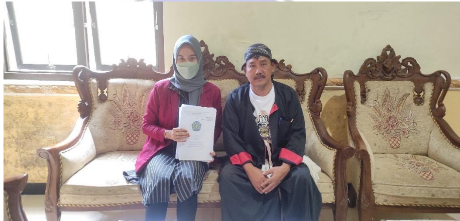
Wawancara dengan Kepala Desa Badegan