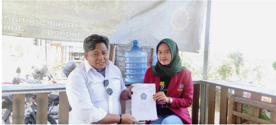
Wawancara dengan Pengelola Bukit Soeharto