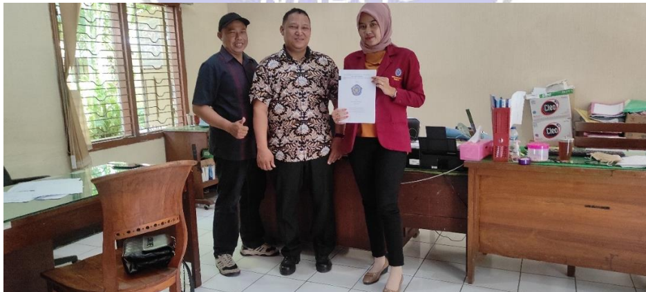
Wawancara dengan Pihak Perhutani