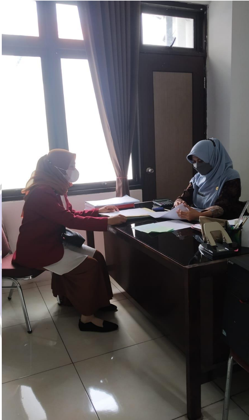
Pengambilan Data dengan Kepala Bagian Keuangan BAPPEDA LITBANG Kabupaten Ponorogo