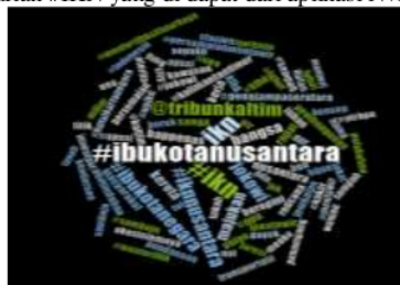
Gambar 2. Data opini publik terkait proses perencanaan pemindahan IKN melalui pencarian #IbuKotaNusantara pada akun twitter yang di dapat dari aplikasi Nvivo 12 Plus.