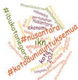
Gambar 3. Data opini publik terkait proses perencanaan pemindahan IKN melalui pencarian #KotaDuniauntukSemua pada akun twitter yang di dapat dari aplikasi Nvivo 12 Plus.