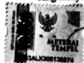
Pipit Indah Puspita