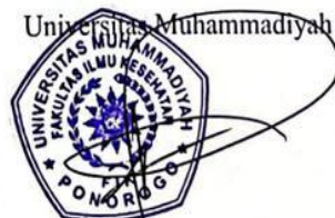
Saiful Nurhidayat, S.Kep.,Ns.,M.Kep