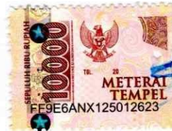
Purwati NIM. 24650591